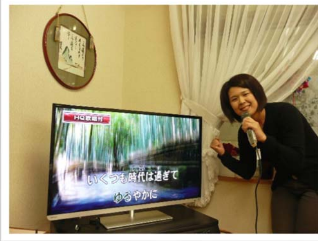
カラオケコーナー