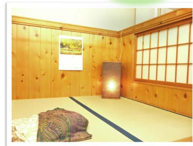
畳おひるねスペース